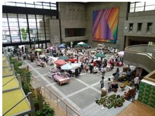
コミュニティプラザ「松山市総合コミュニティセンター」ホームページより