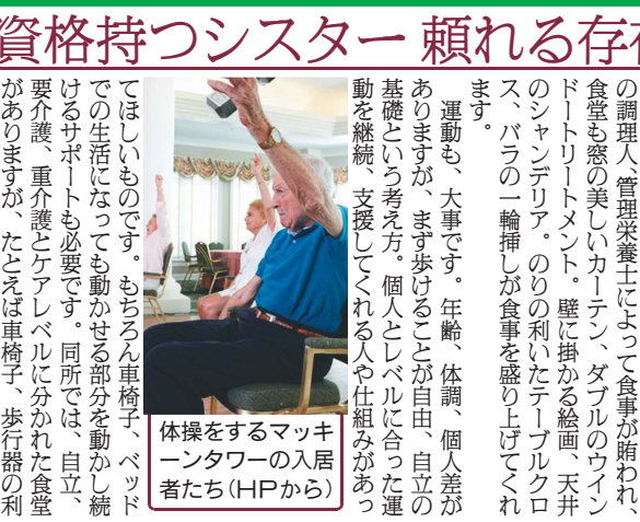
体操をするマッキ ーセンターの入居 者たち

ハワード大学による700余人の若者を 60年間にわたって追跡調査した結果でも、「人 生で最も大切に価値のあるものは、良き人間関係 が、家族、財産などを抑えてトップだったとい います。人生の最終章、手を食して、相談できる 頼れる存在がいるか。必ずしも家族、知人だけで なく、日々の暮らしの中で信頼できる誰かがいる かどうか。同居は看護資格を持つシスターが6人 勤務し、入居者だけでなく、スタッフらのメンター (精神的指導者、助言者)として存在します。これ は自立したものの、素晴らしい「ホスピタリティ ・ケア」(心のこもった手厚いおもてなし)とい えます。良き人間関係は、時には建物設備、せいた くな食事、サービスなどもありがたい「モノ」 であり、「コト」なのですね。