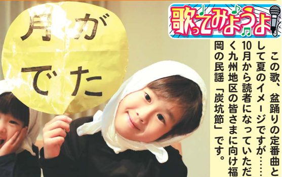
この歌、盆踊りの定番曲と して夏のイメージですが、10 月9日から10月10日まで 九州各地の皆さまに向け福 岡の民謡「炭坑節」です。

月が出た出た 月が出た (ヨイヨイ) 三池炭坑の 上に出た あまり煙突が 高いので さぞやお月さん けむたか ら(サノヨイヨイ) あなたがその気で 云うの なら(ヨイヨイ) 思い切ります 別れます もとの娘の 十八に 返してくれたら 別れます (サノヨイヨイ)